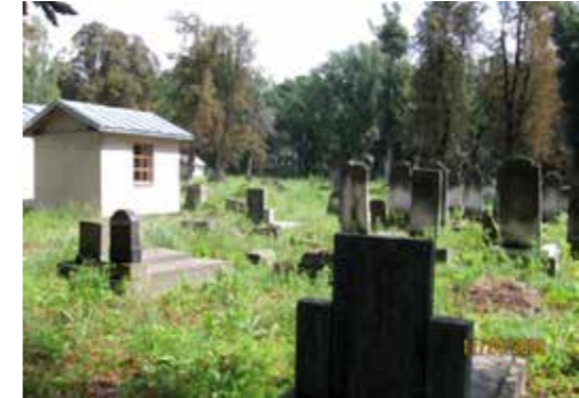
בצד שמאל: שני אוהלים המשוחזרים בבית הקברות בפיוטרקוב. במרחק מה מהם אוהל "האדמו"ר הרופא" 42

הוברנד וחבריו להציל ספרים אלו. הם נכנסו פנימה והזדעזעו מההרס. הם ראו כי אכן נשארו שם מאות ספרים וכמה חפצים נוספים. במהלך כמה דקות הם אספו שלוש מאות ספרים והוציאו אותם מהמקום. סמוך לכניסה, מצא הוברנד שני ספרי תורה עם ידיות עץ. להערכתו, שבוי מלחמה יהודי שהוחזק במקום הוא שהחביאם.