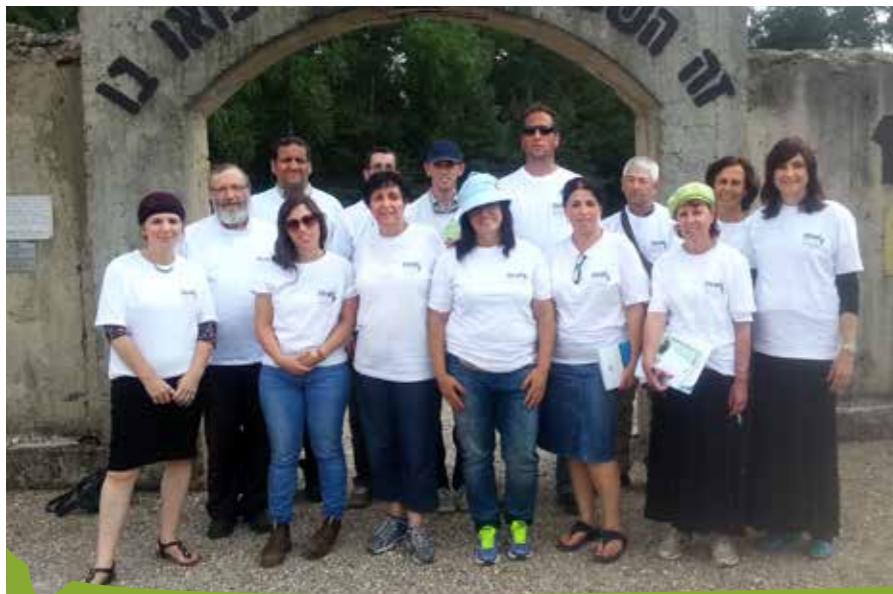
מסע בפולין של קורס מדריכים

אלו היו תחושותינו במסע זה, ובתחושות אלו שבנו ארצה, אל אדמת הארץ הטובה שלנו, לימי מלחמה שטרם הסתיימה. שבנו ובלבנו שאיפה לקיים את מילות הפסוק מאיוב: "כי אדם לעמל יולד" (איוב ה, ז) - "לעמל", ראשי תיבות: ללמוד על מנת ללמד.