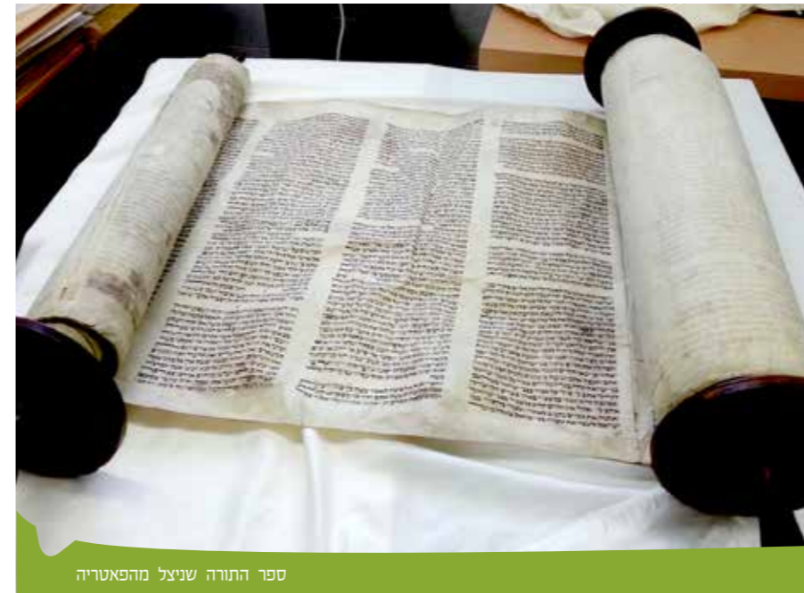
ספר התורה שניצל מהפאטריה

לפני חודשים ספורים, פנתה משפחת המבורגר למכון "שם עולם" בבקשה למסור לידי המכון פריט ייחודי הקשור לסיפור