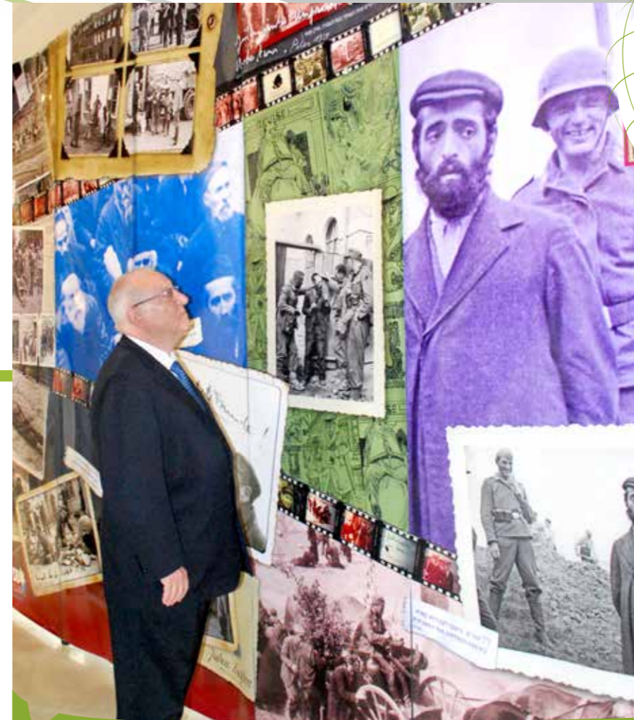
הנשיא ריבלין בתערוכת שם עולם בכנסת