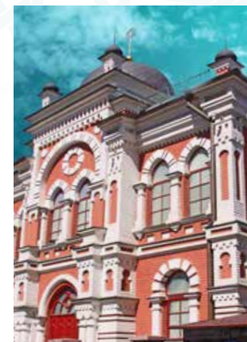
בשער: בית הכנסת כורל הגדול באוקראינה

עורכת: אורית חרמון מערכת: הרב אברהם קריגר, אורית חרמון עריכה לשונית: לאה מזריה עיצוב גרפי: סטודיו בת-עמי צוות בכיר של המכון: הרב אברהם קריגר ראש המכון, הרב משה חבה אגף חינוך, אורית חרמון יועצת פדגוגית מתודית, מרים אריאל אגף ארכיון. צוות המכון: צוות חוקרים, צוות אגף חינוך, צוות ארכיון, צוות כללי.