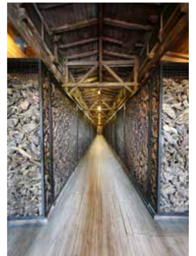
בשעה: צריף הנעליים במחנה ריכוז והשמדה, מיידנק, צילום: אמון הצילום עזרא לנדאו

עורכת: אורית חרמון מערכת: הרב אברהם קריגר, אורית חרמון עריכה לשונית: לאה מוריה עיצוב גרפי: סטודיו בת-עמי