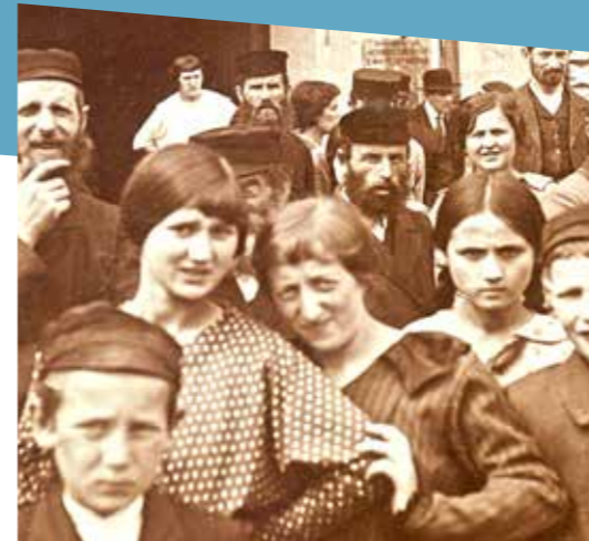
פרק ראשון: אחוות נשים - במחקר הפסיכולוגי וההיסטורי