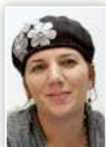
אורית חרמון | עורכת

בחודש שעבר. המדור סוקר את הנושאים השונים שעלו בכנס, המושבים, ההרצאות והמרצים.