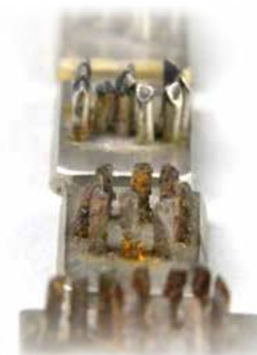
חותמות שנמצאו בפולין אשר שימשו את הגרמנים להטבעת מספר על האסירים.

בשנות התשעים ליוותה אמי משלחות נוער לפולין בתור אשת עדות, ניצולת אושוויץ-בירקנאו, ששרדה יחידה מכל משפחתה. היא ביקשה שאכתוב קטע קצר בתור דור שני לשואה, כדי שתקריא אותו לתלמידים בעת המסע. הסיפור לא נכתב עלי בלבד, אלא גם על אחיותי הגדולות ובכלל, על כל אחי בני הדור השני לשואה. הסיפור שולב בספר העדות 'נערה באושוויץ', שכתבתי יחד עם אמי בהוצאת 'ידיעות ספרים'.