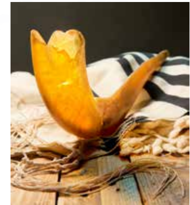
בשנה: שופר ששימש עד ובתוך ימי השואה את בית הוקנים היהודי בפרנקפורט ונמצא לאחר השואה באותו המבנה ונמסר לשם עולם.