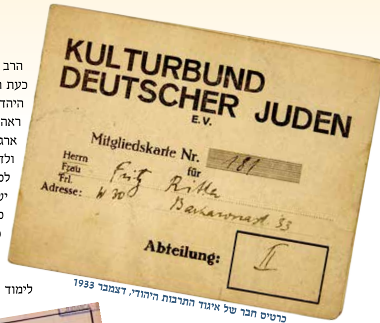
כרטיס חבר של איגוד התרבות היהודי, דצמבר 1933

הרב סבר שתפקיד הרבנים כעת הוא להשריש את מורשת היהדות בלב הילדים. הוא ראה זאת כתפקיד של כל ארגון יהודי הקשור לקהילה ולדעתו המקום הראוי ביותר לכך הוא בית הכנסת, אשר ישמש כמקום לימוד גם כן. מאותה העת הוא החל כל פעילות בבית הכנסת בשיעור ולימוד, זאת מכיוון שראה כי בכוח לימוד התורה תתחזק רוחם של האנשים.