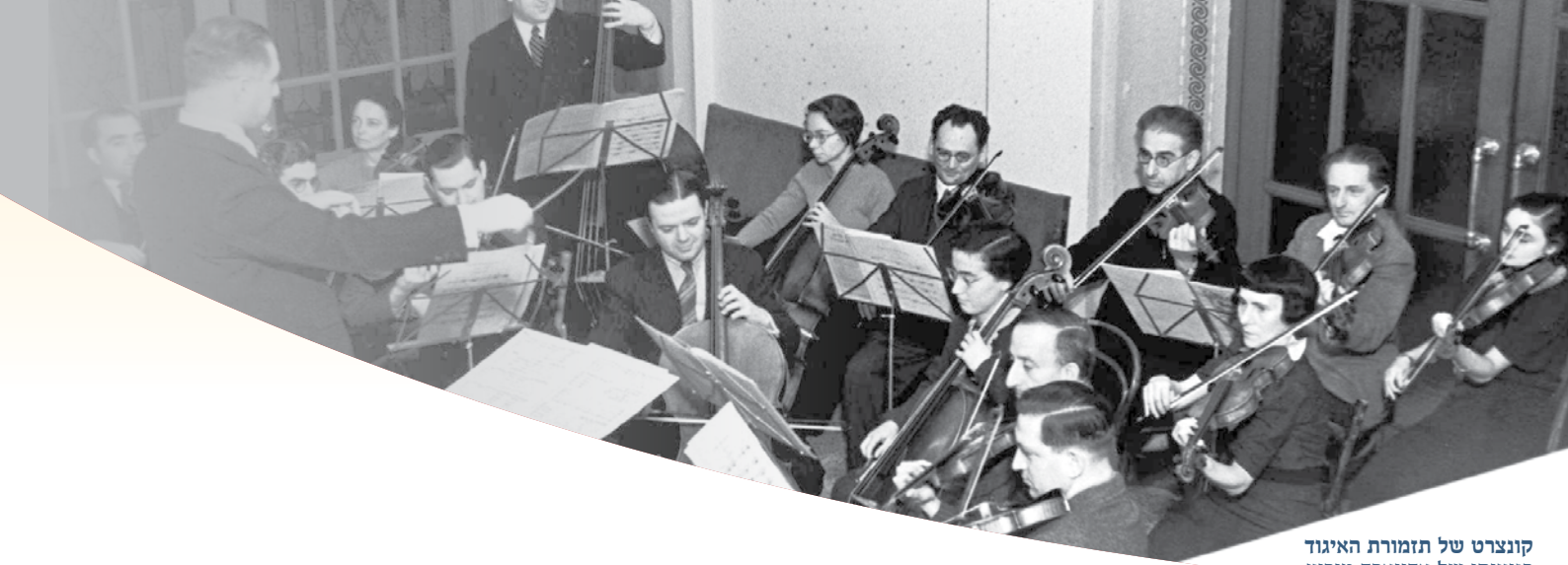
קונצרט של תזמורת האיגוד בניצוחו של אדוארד מוריץ דצמבר 1936