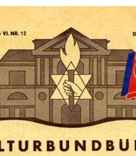
תוכנית הצגת תיאטרון

רוח זו אשר לוותה במעשים של ממש, כפי שראינו, יצרה שוב רנסנס רוחני, תרבותי, חינוכי תוך כדי העמקה לתודעה והזהות היהודית הגאה, שטופחה במשקל נגד לביטויי השנאה והבוז שרחש הרחוב הגרמני. במקביל התקיימה גם מערכת של פעילות אינטנסיבית להוראת מבוגרים במסגרת קורסי ערב, שהחלה כבר בקיץ 1933. הקורסים התקיימו במוסדות שנקראו "בית הלימוד", Lehrhaus. כל