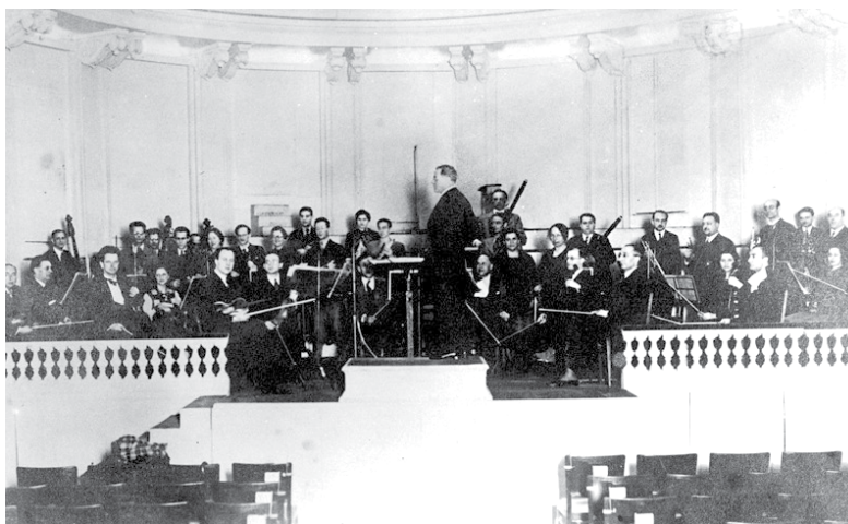
קונצרט איגוד התרבות היהודי בפרנקפורט

מסמכים בני תקופה מספקים הסבר להודעה מפתיעה ובלתי-צפויה זו: הינקל הושפע רבות מדעותיו האנטישמיות של אחד מתועמלני הנציונל-סוציאליזם הארסיים ביותר, אלפרד רוזנברג. רוזנברג דגל בדעה, שיש להציל את התרבות ה"ארית" מהשפעותיה המזיקות וההרסניות של התרבות היהודית. "היהדות מהווה סכנה מוחשית לרוח הגרמנית-הארית הטהורה". 19