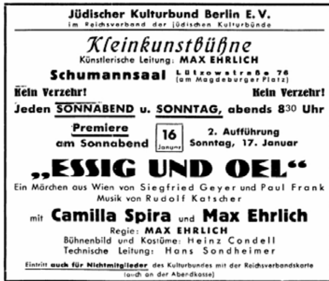
רחון איגוד התרבות היהודי ובו פרסום למופע קברט הומוריסטי בברלין.

וליצור תרבות "ארית", בה לא תהיה ליהודים ולכוח היצירה המלאכותי וההרסני שלהם דריסת רגל. ברם, הצמא לתרבות, מרכיב כה אופייני בעולמם הרוחני של יהודי גרמניה, לא הותר זמן רב לואקום שנוצר. סגירת