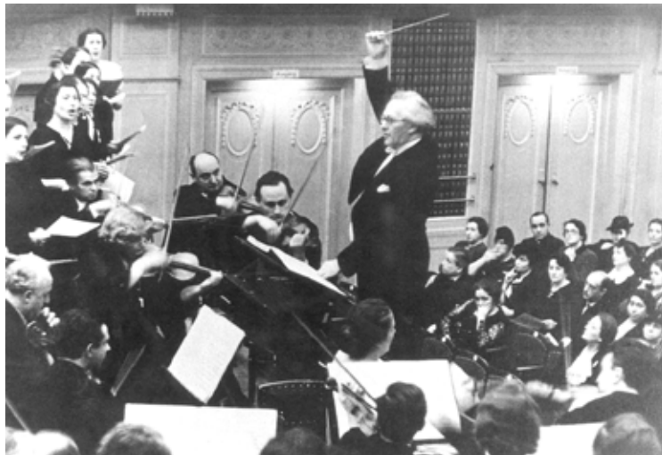
קורט זינגר מנצח בברלין על תזמורת "איגוד התרבות היהודי"

השנים 1935 ו-1936 היו שנות השיא במו"לות היהודית בגרמניה הנאצית. אחר כך חלה ירידה בגלל התגברות הקשיים שגרמה ה"אריזאציה", בעיקר במישור הכלכלי. הספר הפופולארי ביותר שהופיע בשנים הנידונות היה ספרו של הרב יואכים פרינץ, "אנחנו הננו יהודים". הביקורת היללה את הספר ויצאה מגדרה בדברי שבח: "הספר ממלא שליחות חשובה מאין כמוה", נכתב באחת הסקירות. הספר היה גדוש בדברי עידוד ליהודים בשעתם הקשה, תוך שימוש בדוגמאות היסטוריות מן המקורות. המחבר עודד את קוראיו לשוב לחיקה של היהדות, כי רק שם ימצאו מזור למצוקותיהם. יש עתיד ליהדות ולעם ישראל, זעק המחבר מדם לבו. 35 בהוצאת "שוקן" הוותיקה והמוערכת ראתה אור סידרה בת 100 כרכים (!), שנקראה "ספריית שוקן". בסידרה התפרסמו ספרים חשובים בתחום מדעי היהדות, שהמכנה המשותף שלהם היה