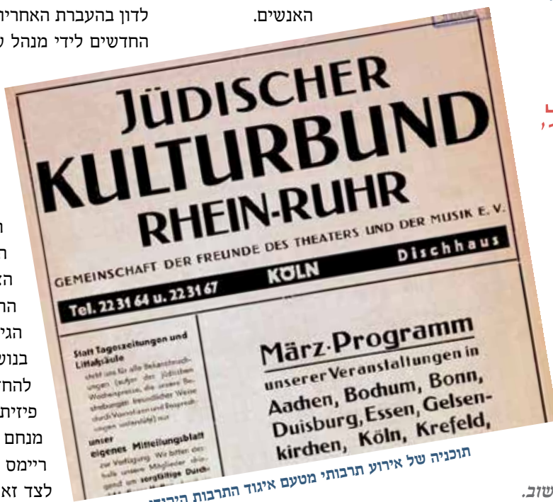
תוכניה של אירוע תרבותי מטעם איגוד התרבות היהודי

הוא הקים ספרייה עשירה בבית הכנסת על מנת לתת עוד סיבה לפקוד את המקום. הוא פנה אל הנוער, גם לאלו שעד לא מכבר לא היה להם קשר ליהדותם, והם נענו לקריאתו לפקוד את בית הכנסת. הוא הקים חוגי לימוד לא רק בעיר כהונתו אלא נסע לעיירות קטנות כדי לתת שם שיעורים. למרות שנסיעה זו הייתה כרוכה בסכנה, הוא התמיד בכך, אף אם האמור היה בקבוצות קטנות ממש. 25 גם במערכת החינוך היהודי המסודר ניצבו מעתה בפני היהודים אתגרים ברורים, שנבעו מהגידול החד במספר התלמידים והרקע