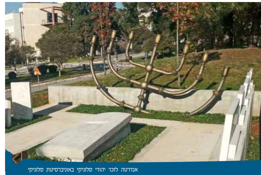
אנדרטה לזכר יהודי סלוניקי באוניברסיטת סלוניקי

משם המשיכה הקבוצה לנמל. בימיה המפוארים של יהדות סלוניקי, שבת הנמל מכל מלאכה בשבת. נוף המקום הוא כגלויה תכולה, מרגיעה ועוצרת נשימה. עברנו את הכביש ונעמדנו במרכז של "כיכר החרות", שהעמידה בה הייתה עבורנו ניגוד חריף למראה הנינוח והשלו של הנמל, שכן כיכר זו הייתה "כיכר השילוחים" בתקופת השואה. במרכז הכיכר מוצבת אנדרטה מרשימה לזכר שואת יהודי סלוניקי. המשכנו משם