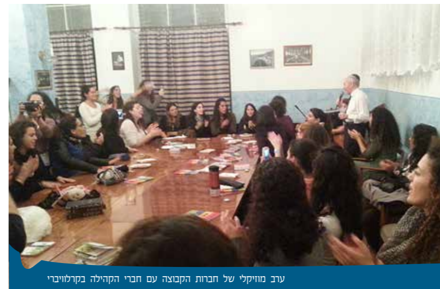
ערב מוזיקלי של חברות הקבוצה עם חברי הקהילה בקרלוביברי