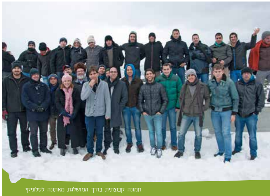
תמונה קבוצתית בדרך המושלגת מאתונה לסלוניקי

מהמקום שבו היה בית הקברות הישן. בבית הקברות מצבות ושרידים מבית הקברות היהודי הישן, שאותו הרסו הנאצים. כן יש במקום אנדרטת הנצחה לזכר יהודי סלוניקי